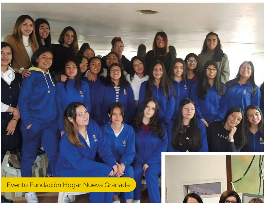
Evento Fundación Hogar Nueva Granada