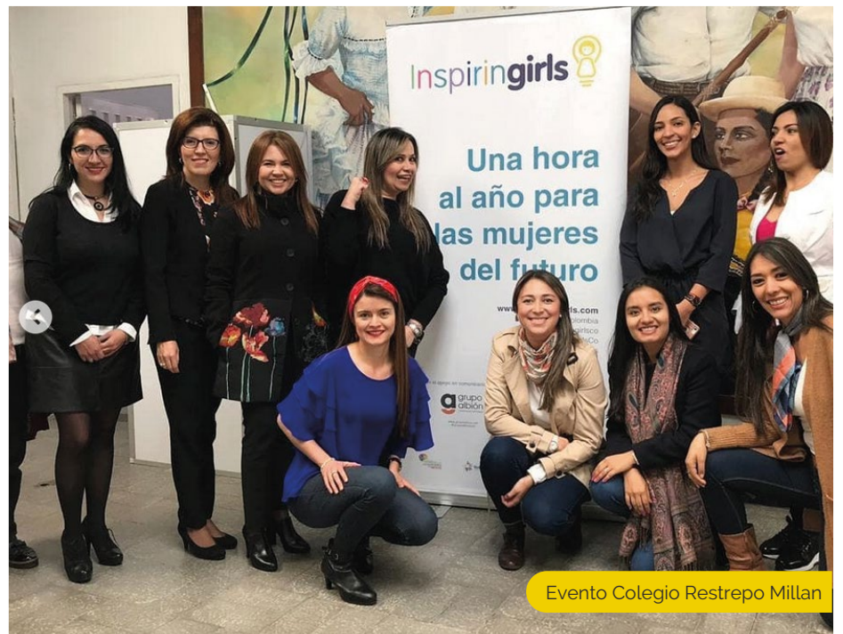
Evento Colegio Restrepo Millan