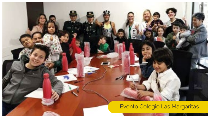
Evento Colegio Las Margaritas