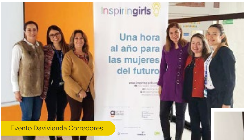
Evento Davivienda Corredores