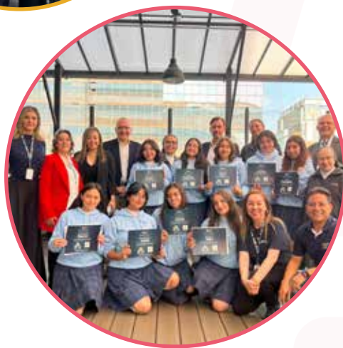
Estudiantes del Colegio Margarita Bosco