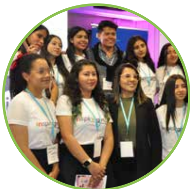
Función Hogar Nueva Granada