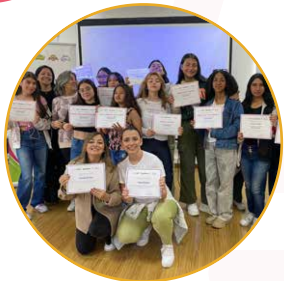
Estudiantes de la red de colegios de la secretaria de educación