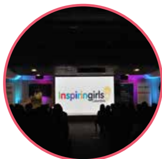
Evento Reconocimientos 2023